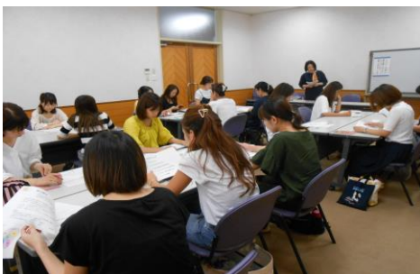
就職活動や子育てについて話す講師

ど簡単でない。物理的な問題もさることながら、一番高いハードルは自分自身の『心の壁』を乗り越えることです。今後の就職活動の成果に期待を寄せた。