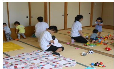
お子様を託児室で預かる保育士