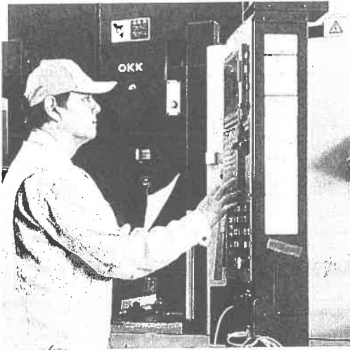
【訓練の様子】 NC工作機械の操作実習

基礎となる測定機器の取り扱い、図面の読み方、汎用工作機器の操作方法などを学んだうえで、NC工作機械についてはプログラムの作成から機械のセッティング、実際の加工まで行います。これらを学ぶことで精密な機械加工に関する知識と技能の習得を目指します。