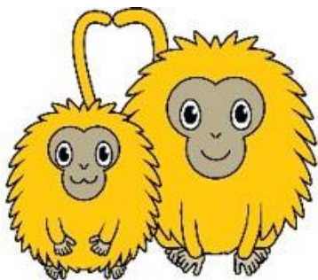
はまリン&ここリン