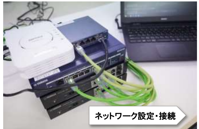
ネットワーク設定・接続

「IoT」とは、「ありとあらゆるモノをインターネットに接続する」という意味です。IoTエンジニアは、 組込機器 を含む「 ソフトウェア開発技術 」、 センサ など接続するための「 デバイス設計技術 」、インターネットに接続するための「 ネットワーク構築技術 」の3要素が必要不可欠で、当科ではその習得を目指します。