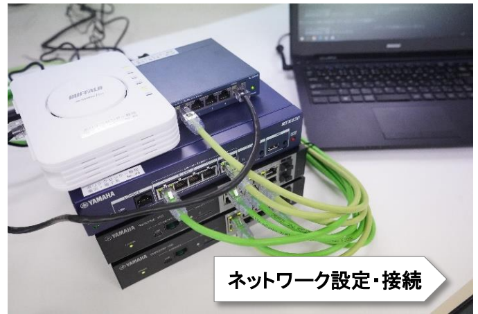
ネットワーク設定・接続

「IoT」とは、「ありとあらゆるモノをインターネットに接続する」という意味です。IoTエンジニアは、組込機器を含む「 ソフトウェア開発技術 」、センサなど接続するための「 デバイス設計技術 」、インターネットに接続するための「 ネットワーク構築技術 」の3要素が必要不可欠で、当科ではその習得を目指します。