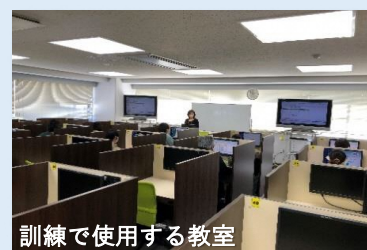
訓練で使用する教室