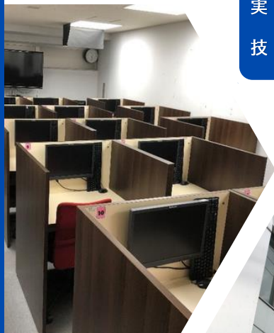
▲ 訓練で使用する教室