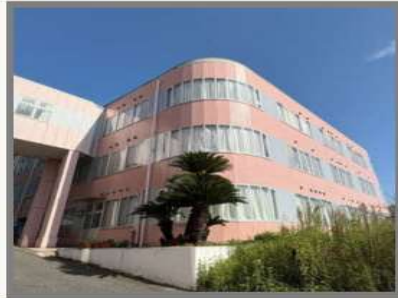
山の上介護医療院