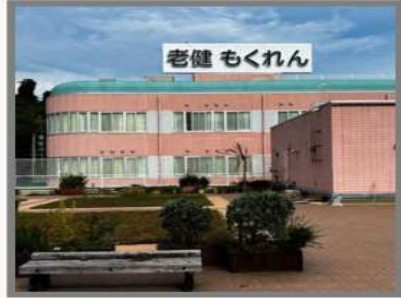
介護老人保健施設もくれん