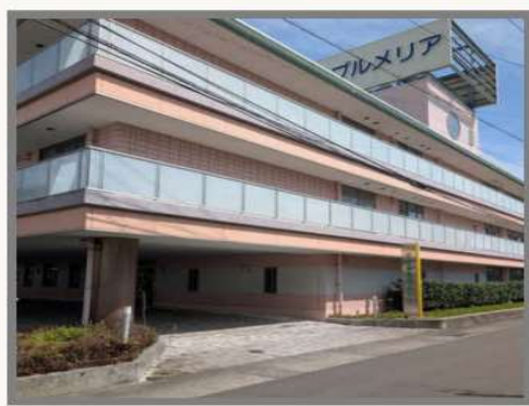
介護老人保健施設プルメリア