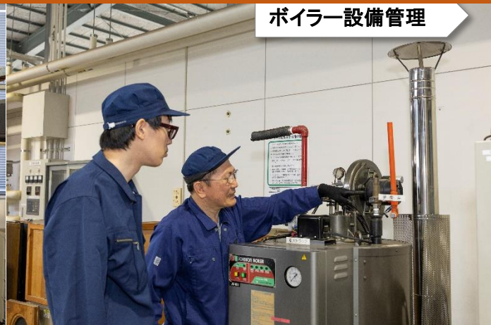
ボイラー設備管理