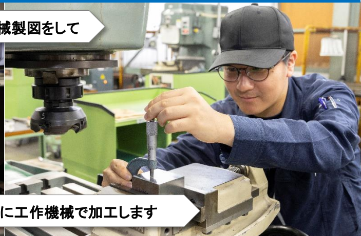
実際に工作機械で加工します