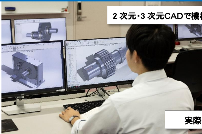
2次元・3次元CADで機械製図をして