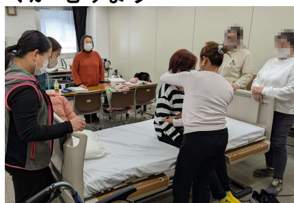
ぎじゅつを みに つけます