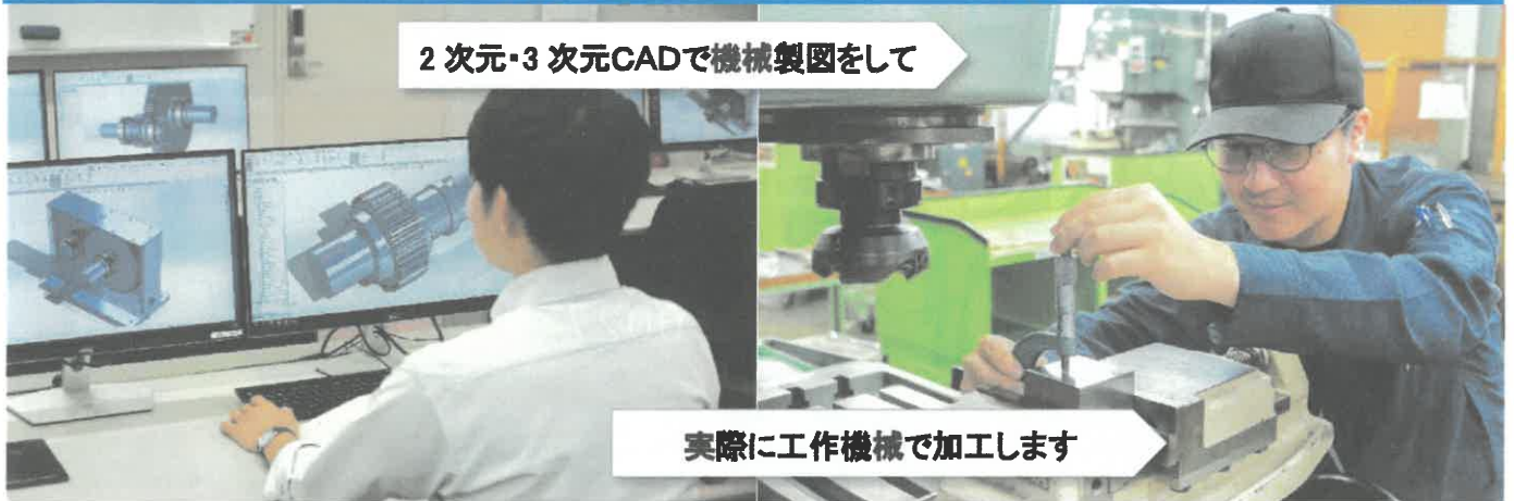
2次元・3次元CADで機械製図をして