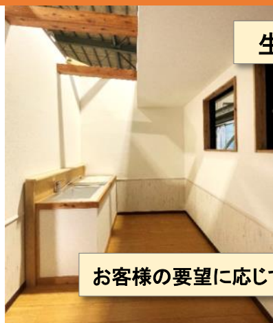
生まれ変わったキッチン