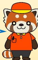
静岡労働局人材確保事業 公式キャラクター「ルー」