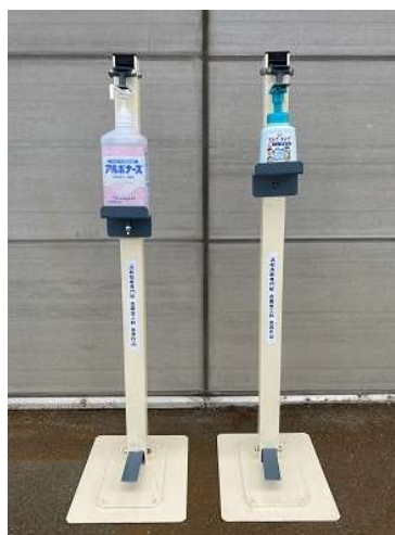
【実習課題（例）】 足踏み式消毒スタンド