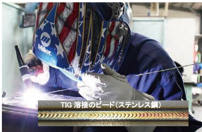
TIG 溶接のビード(ステンレス鋼)

アーク溶接 とは空気のような気体に電気を流す、放電現象を利用して金属を溶かして接合するものです。