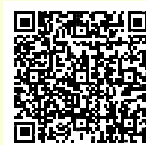
ハローワーク静岡 マザーズコーナー 特設ページ