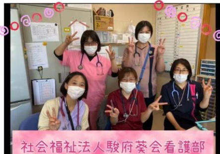
社会福祉法人駿府葵会看護部