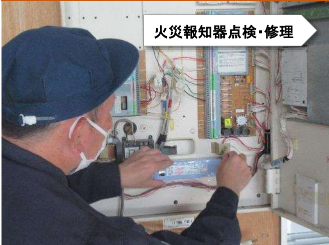
火災報知器点検・修理