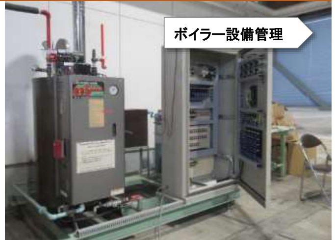
ボイラー設備管理