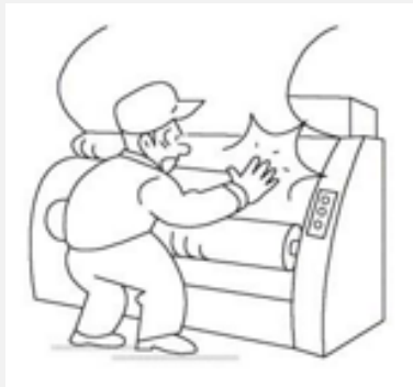
製造業ではさまれ・巻きこまれ