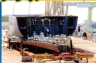
船台にブロックを搭載し建造