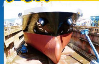
乾ドックでリフレッシュ!