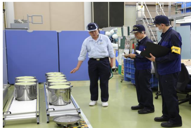
①の工場で説明を受ける笹局長(右から2人目)と森署長(右端)