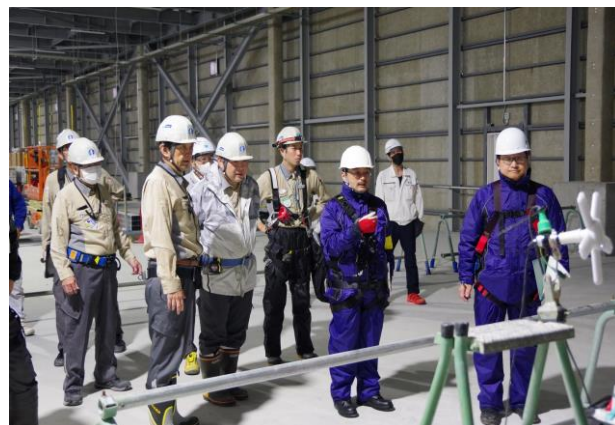
③の現場で説明を受ける皆野川課長(右から3人目)と榎原副署長(右端)