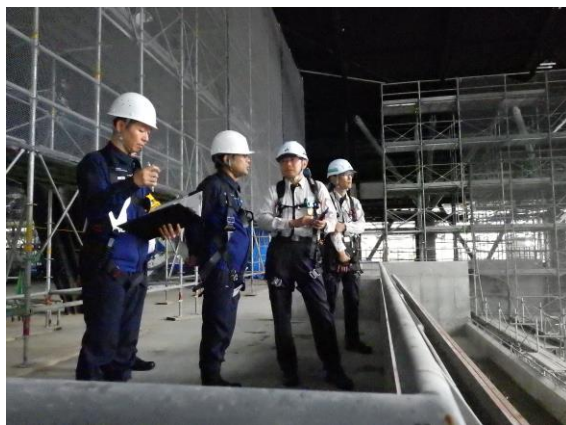
②の現場で説明を受ける神田部長(左から2人目)と町田署長(左端)