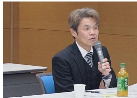
※荷主企業への効果的な周知・啓発に関して意見を述べる笹局長