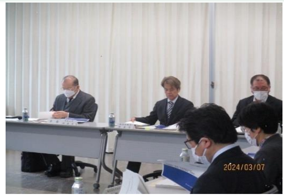
静岡地域職業能力開発促進協議会の模様

地域の関係者に参画いただき、令和4年度から直近の公的職業訓練の実績やワーキンググループによるヒアリング結果等を踏まえて、地域の実情に応じた人材ニーズについて協議を行い、令和6年度静岡県地域職業訓練実施計画を策定しました。この計画に基づき、関係者間で連携して、地域のニーズを反映した訓練コースを設定していくとともに、デジタル分野における能力開発の重要性の発信や、応募率や就職率の向上に向けた取組等によって、効率的かつ効果的な公的職業訓練を実施していきます。