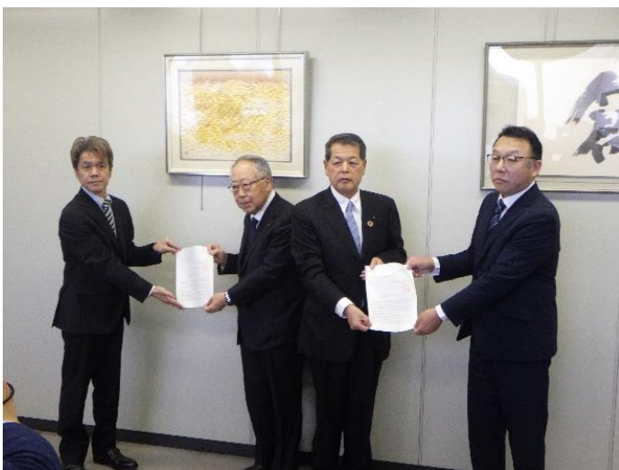
静岡県中小企業団体中央会役員室にて

物流の2024年問題に向けて、静岡労働局長及び中部運輸局静岡運輸支局長が、一般社団法人静岡県商工会議所連合会及び静岡県中小企業団体中央会に対して、トラック事業の取引環境の適正化や生産性の向上に向けた取組をより一層高めるための協力要請を行いました。