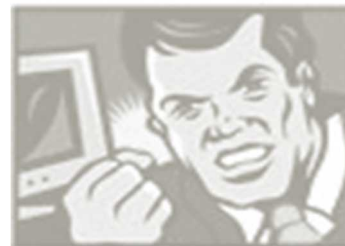
訓練修了により、自分自身のスキルアップに自信を深めた様子です。