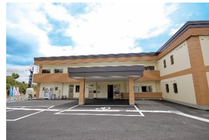
ふじがおか見付連理枝