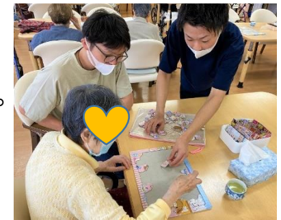
デイサービスでの様子

A3.色々な仕事や職場があるので 職場体験や見学など、どんどん 行って見て回るといいと思います。 仕事は一日の内の長い時間を 占めるので、雰囲気合う会社に入 れるといいですね！ 社会人も楽しいよ！