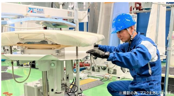
※撮影の為、マスクを外しています

三井物産のグループ企業として、ユニフォームレンタル業界売上NO.1！ 安定して創業以来34年間売上成長継続している会社です。 ホワイト認定を取得しており、上司との距離が近く、風通しの良さが当社の自慢です！ 会社と仕事に慣れてもらえるよう支援を惜しみません。 仕事でもそれ以外でも相談しやすい体制を整えております！