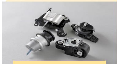
エンジンマウント