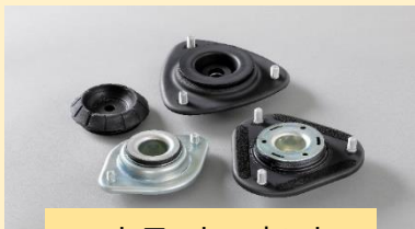
ストラットマウント