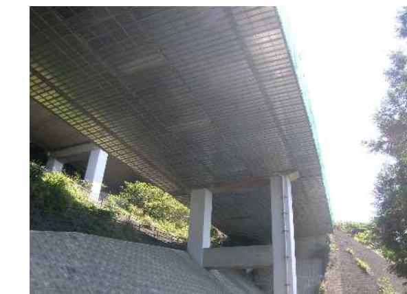
吊り足場組立完了