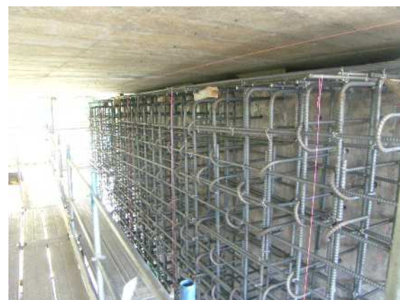
パラペット増厚工鉄筋組立状況