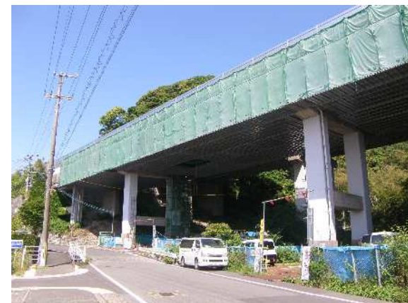
吊り足場組立完了