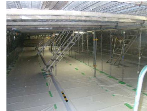
吊り足場内部状況