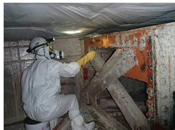
塗膜掻き落とし状況