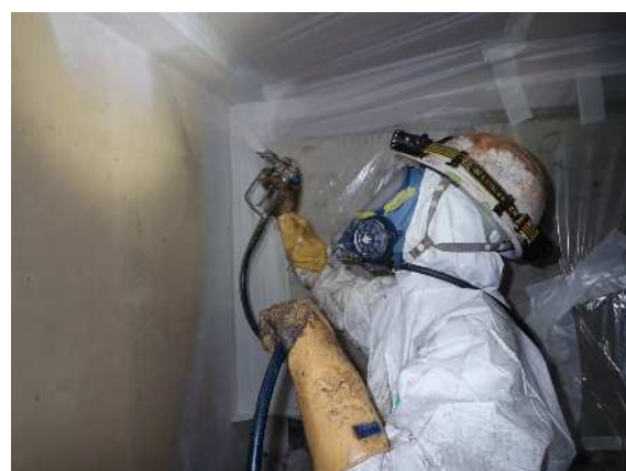
塗膜はく離材吹き付け状況