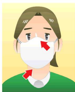
①マスクを着用する (口・鼻を覆う)

○ 体調が悪い方や風邪症状がある方は、来所を控えていただきます ようお願いいたします。 ○また、ハローワークへの来所の際は、 マスクを着用のうえ、咳エチケットのご協力 をお願いいたします。