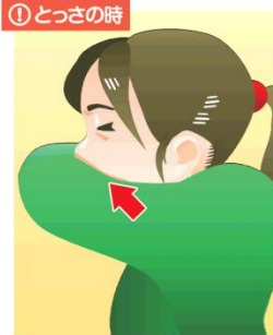
③袖で口・鼻を覆う

ティッシュ:使ったらすぐにゴミ箱に捨てましょう。 ハンカチ:使ったらなるべく早く洗いましょ。