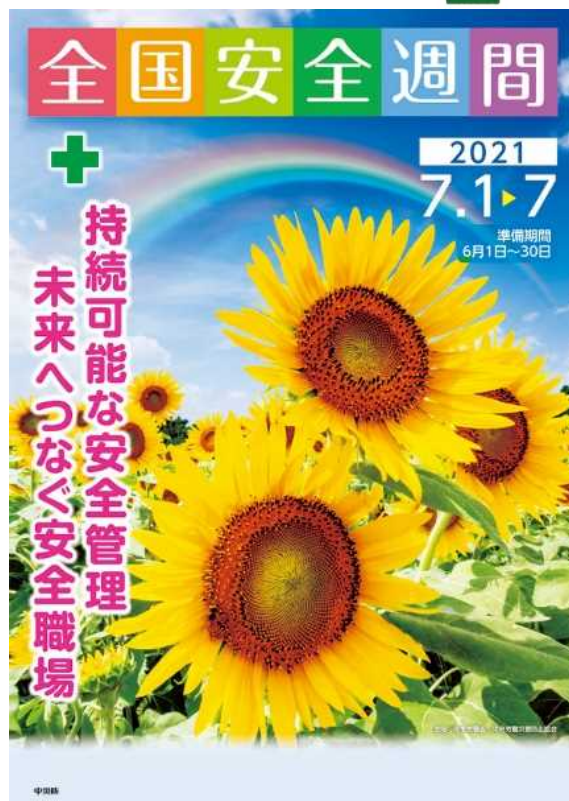
中災防 全国安全週間ポスター

6月は安全週間準備期間ですので、県内各地区労働基準協会が主催する安全週間説明会をご活用いただくなど計画的な準備をお願いします。 いったん労働災害が発生すれば、被災された労働者やそのご家族が辛い思いをするのみならず、事業活動にも大きな影響が生じます。 労使が一体 となって、 新型コロナウイルス感染症に対する基本的な感染防止対策を徹底 するとともに、 将来を見据えた持続可能な安全管理 に取り組んでいきましょう。