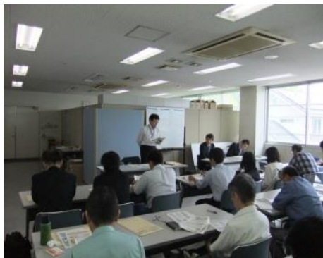
静岡会場(ハローワーク静岡)