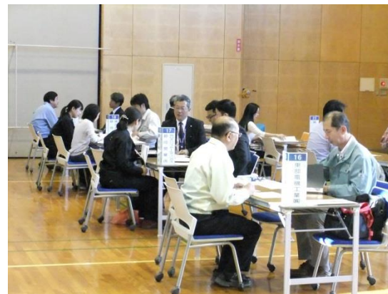
静岡会場（ポリテクセンター静岡）