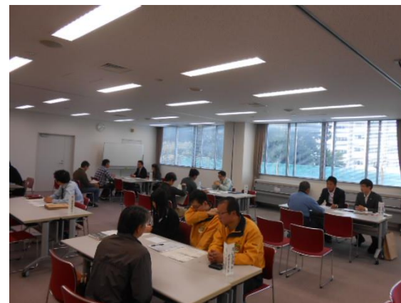
トラック就職相談会(三島)