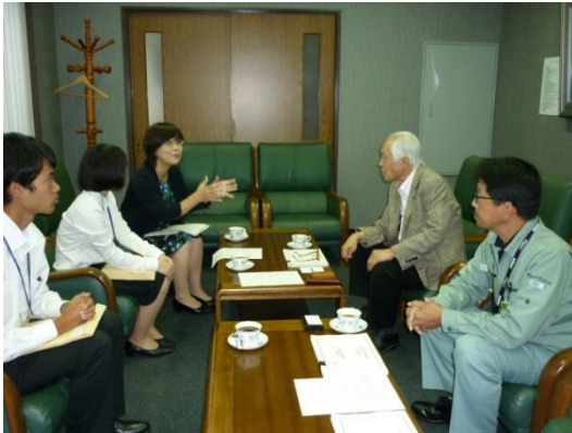
↑ 9/7 株式会社キグチテクニクスを訪問