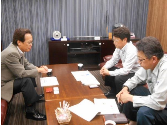
↑ 9/22 出雲造機株式会社を訪問