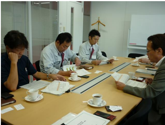
↑ 9/6 松江第一精工株式会社を訪問