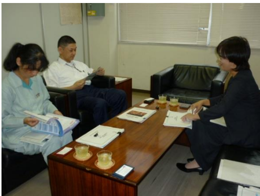
↑ 9/20 株式会社 守谷刃物研究所を訪問