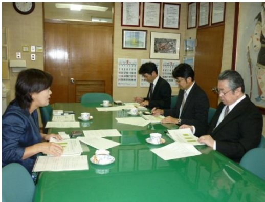
↑ 9/12 社会福祉法人 せんだん会を訪問