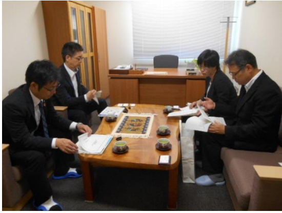
↑ 8/3 社会福祉法人島根ライトハウスを訪問