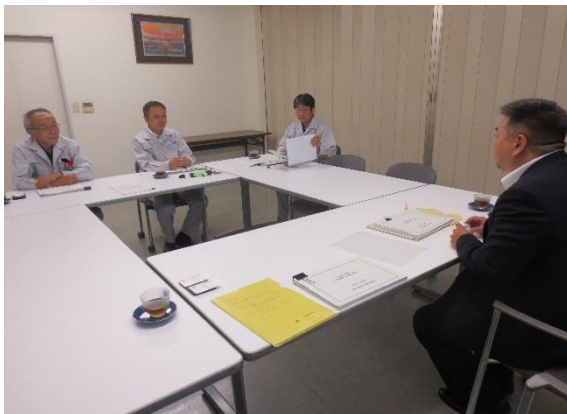
↑ 8/29 三刀屋金属株式会社を訪問