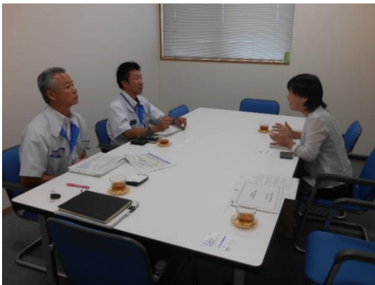
↑ 8/25 城東化成株式会社を訪問