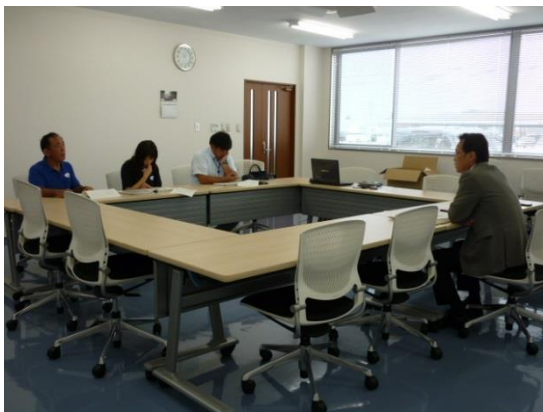
↑ 8/25 株式会社デルタ・シー・アンド・エスを訪問