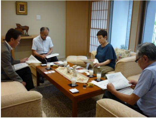
↑ 8/25 社会福祉法人いわみ福祉会を訪問