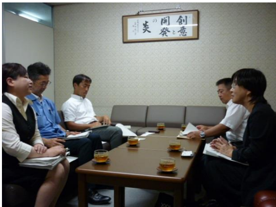
↑ 8/8 株式会社 パッケージ中澤を訪問

「島根労働局働き方改革推進本部」では、平成29年8月に労働局長(浅野茂充)、労働基準部長(高橋秀寿)、雇用環境・均等室長(周藤明美)等幹部が県内企業を訪問し、「働き方改革」の取組に向けた協力要請を行いました。