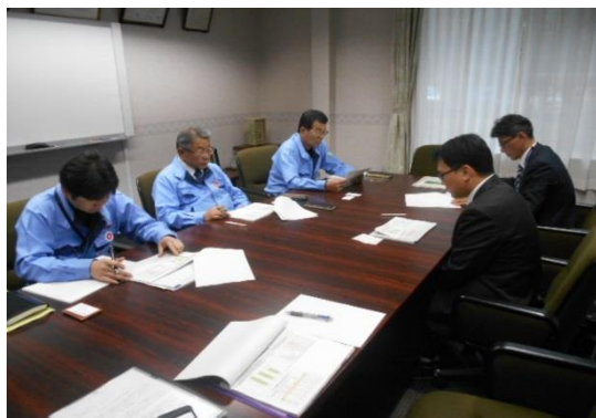
↑ 11/8 島根イーグル株式会社を訪問