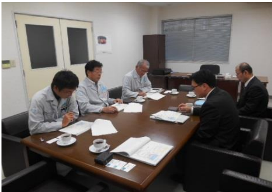
↑ 11/8 ヒラタ精機株式会社を訪問