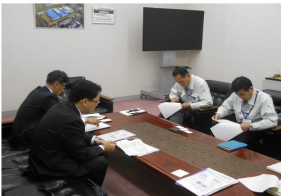
↑ 11/8 島根三洋電機株式会社を訪問