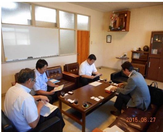
↑8/27 若女食品株式会社を訪問