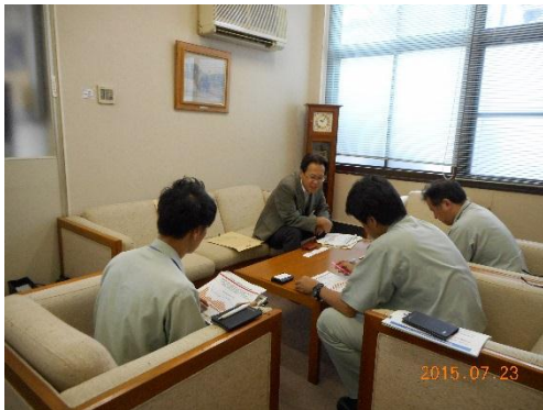
↑7/23 三菱農機株式会社を訪問

「島根労働局働き方改革推進本部」では平成27年7月に島根労働局長（古田宏昌）及び労働基準部長（高橋秀寿）が県内企業3社を訪問し、「働き方改革」の取組に向けた協力要請を行いました（以下掲載は2社分）。