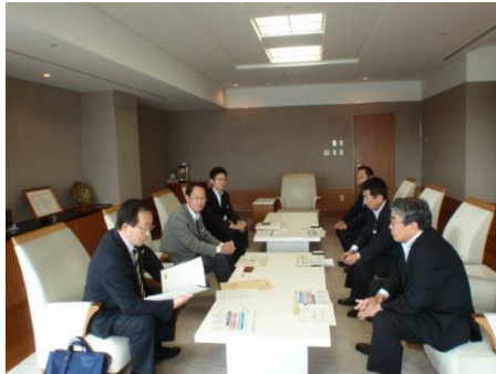
↑ 6/9 株式会社山陰合同銀行を訪問