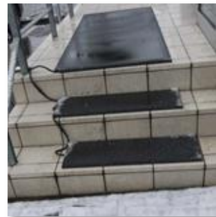
<ヒートマットの設置例>

天候による交通機関の遅れが見込まれる場合は、時間に余裕をもって出勤するようにし、落ち着いて作業をするように心がけましょう。屋外では、小さな歩幅で靴の裏全体を付けて歩くようにしましょう。