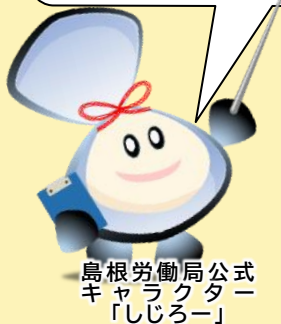
島根労働局公式 キャラクター 「しじろー」