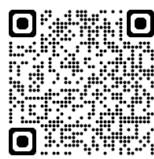
島根労働局HP「業務改善助成金について」