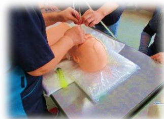
医療的ケアも学べます できるまでしっかり 教えてもらえます