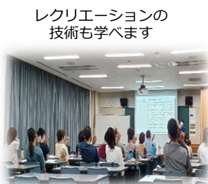
レクリエーションの 技術も学べます