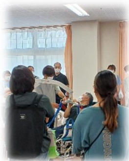
施設見学や 施設実習があります