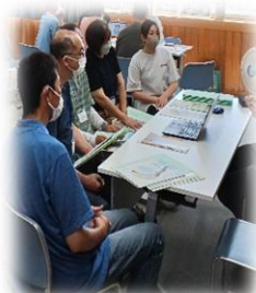
色々な介護事業所の 仕事内容について 直接お話が聞けます