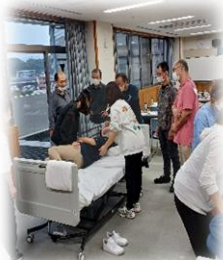
実技はゆっくり丁寧に 教えてもらえます