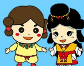
いなたひめちゃん すさのおくん