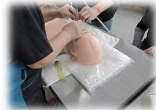
医療的ケアも学べます できるまでしっかり 教えてもらえます