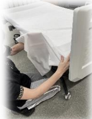
実技はゆっくり丁寧に 教えてもらえます