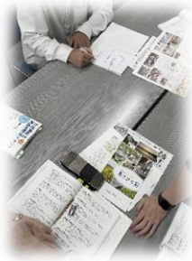
色々な介護事業所の 仕事内容について 直接お話が聞けます