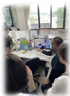
先輩の修了生に 直接お話が聞けます