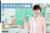
【これでOK！】あらゆるビジネス に役立つ！はじめての実践マーケティ ング講座