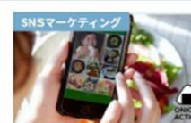
【ファン心を掴む】実例から学ぶ最 先端のソーシャル・マーケティング戦 略