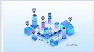
今日から始めるデジタル トランスフォーメーション