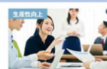
チームの生産性が2倍！！最高品質の会 議術～生産性の向上は会議で9割決ま る～