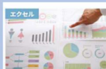
【初心者から上級者まで】1日で学べ るエクセルの教科書 マスターコース