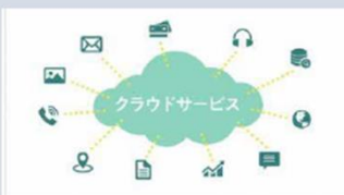
ミニアニメで解説！やさしい 『DX・IT用語』入門