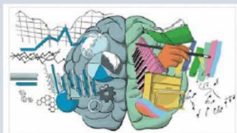
あなたのチームの創造力を 強くする 10のフレームワ ークと思考法