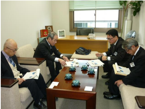
↑ 2/2 合銀ビジネスサービス株式会社を訪問