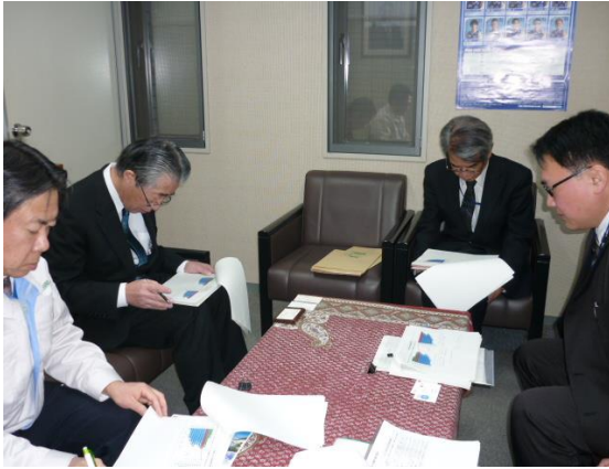
↑ 2/1 株式会社田部を訪問