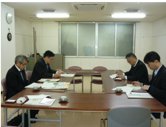
↑ 2/2 株式会社 今井書店を訪問