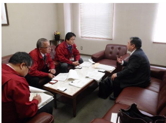
↑ 1/13 株式会社 ジュンテンドーを訪問