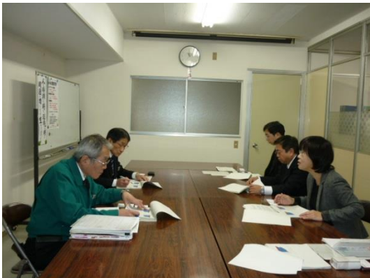
↑1/26 株式会社 マルマンを訪問