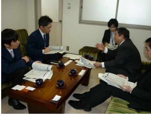
↑1/18 株式会社 みしまやを訪問