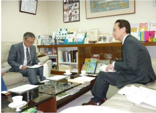
↑11/14 島根ナカバヤシ株式会社を訪問