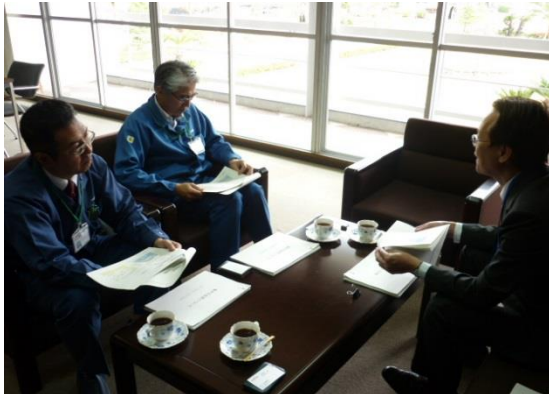
↑11/14 株式会社イワミ村田製作所を訪問