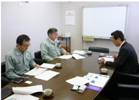
↑11/18 株式会社 日立メタルプレジジョンを訪問