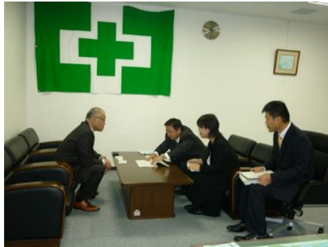
↑ 11/22 株式会社 日本海技術コンサルタンツに協力を要請

また、同月に労働基準部長(高橋秀寿)、職業安定部長(大橋泰之)が県内企業を訪問し「働き方改革」の取組に向けた協力要請を行いました。