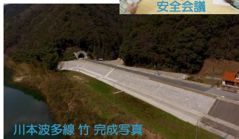
川本波多線 竹 完成写真