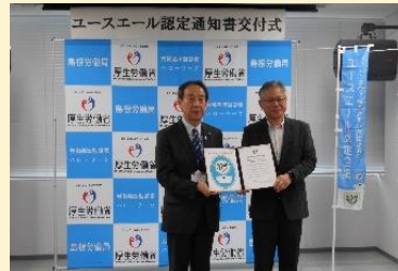
株式会社アキウトシスコム