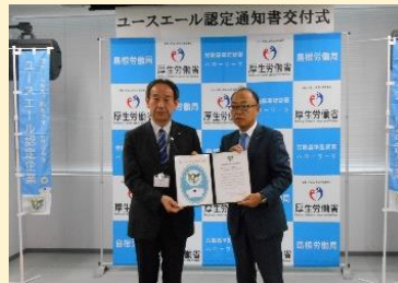
株式会社ワールド測量設計