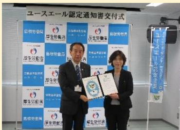
梅木建設株式会社