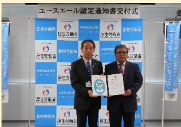
山陰総業有限会社