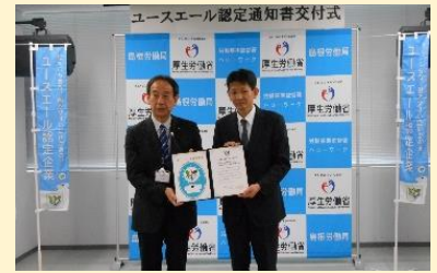
株式会社島根情報処理センター