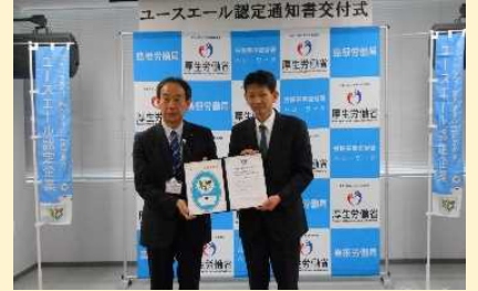
株式会社島根情報処理センター