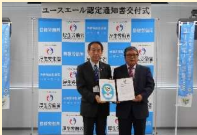
山陰総業有限会社