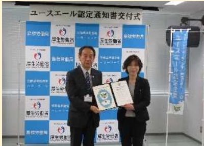
梅木建設株式会社