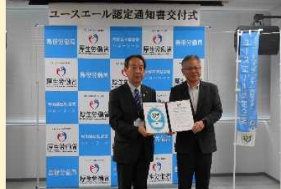
株式会社アキュートシスコム