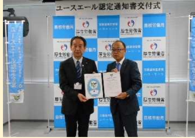
株式会社ワールド測量設計