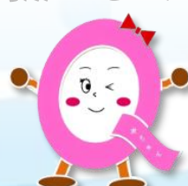
求職者支援課 求ちゃん