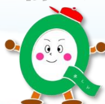
求職者支援課 求くん